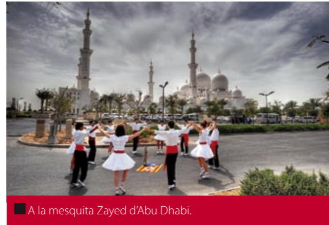
■ A la mesquita Zayed d'Abu Dhabi.