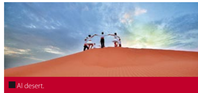
■ Al desert.