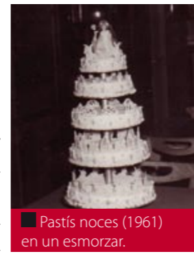
Pastís nocces (1961) en un esmorzar.

Tot i que també se'n pot dir lluna de mel, aquí a Bellpuig sempre n'han dit passejada. Possiblement el seu origen