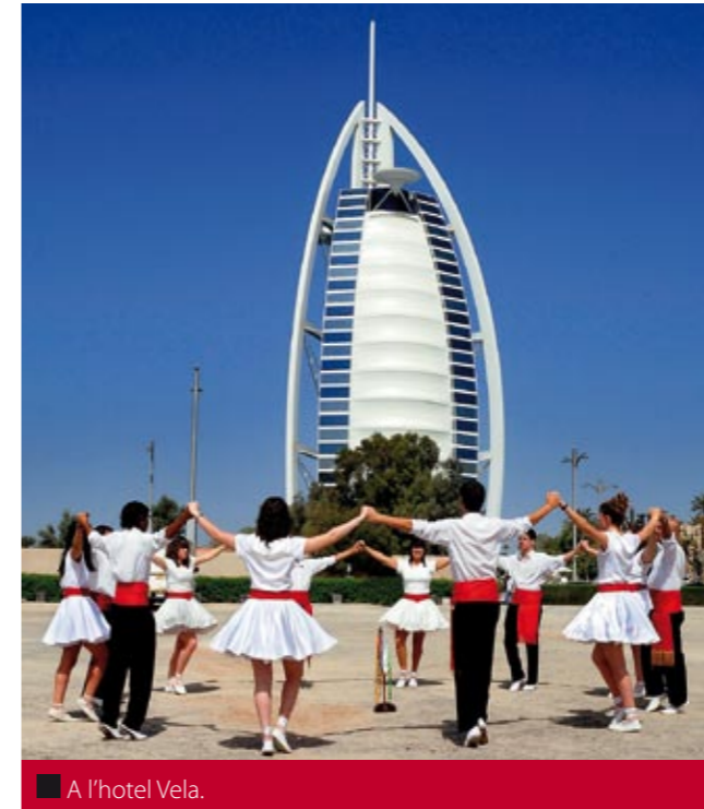
■ A l'hotel Vela.