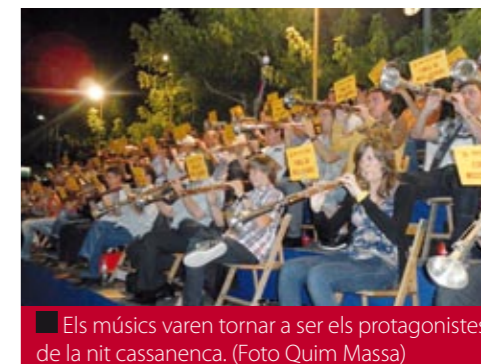
■ Els músics varen tornar a ser els protagonistes de la nit cassanenca.

L'anècdota de la nit la va provocar una apagada general de llum per la cremada d'un generador