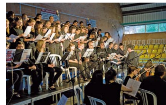
■ Un moment d'un fragment de la intervenció de l'orquestra i cors de l'Escola de Música de Puig-reig.

ocasions. El mestre Xavier Guitó al piano, va estrenar un arranjament de l'obra La flama , composta per Joaquim Puig i dedicada a Ramon Noguera.