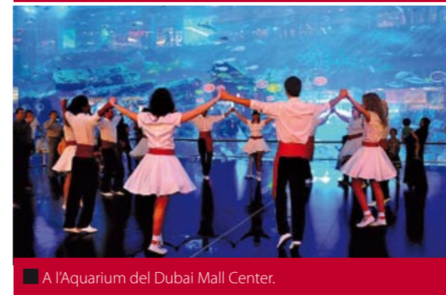
■ A l'Aquarium del Dubai Mall Center.

En acabar, i com si encara no n'haguessin tingut prou, van trobar que la llum ja ben esmorteïda del final del dia que evidenciava el començament de la nit i el silenci que hi havia en aquell punt del desert prou allunyat de la conurbació de la capital, era l'hora i el lloc adients per donar-se les mans tots setanta i escoltar el Cant dels ocells per demanar, alhora, que el silenci i la pau que sentien s'escampessin arreu del món.