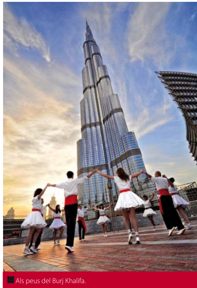
■ Als peus del Burj Khalifa.

No obstant això, quan tot just acabaven de ballar la sardana van ser interceptats per un parell de responsables del lloc, als quals cada vegada s'hi afegiren més reforços. Deien que allà no s'hi podia ballar i demanaven explicacions. L'estira i arronsa es va perllongar durant mitja hora ben llarga, i, finalment, volien que esborressin les fotos i les pel·lícules que havien filmat ballant. Fins i tot van pujar a dalt dels autocars a registrar-los i demanar les càmeres, però no van tenir gens d'èxit en esborrar les imatges que perseguïen. Els catalans, en tot moment, es van mostrar respectuosos, com si fossin angelets, i sort n'hi va haver que la cosa no va anar a més i van deixar partir l'expedició. No va caldre pas, doncs, anar a "ballar" a la garjola d'Abu Dhabi.