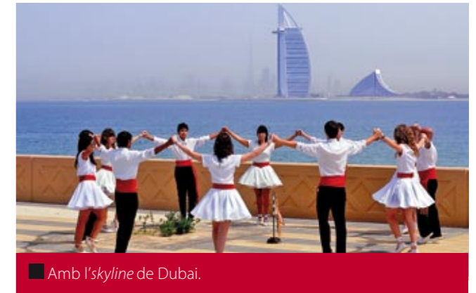
■ Amb l'skyline de Dubai.

Aquest gratacel, de 321 metres, va ser la primera icona mundialment coneguda de l'emirat, i fou el primer hotel construït en forma de vela, del món.