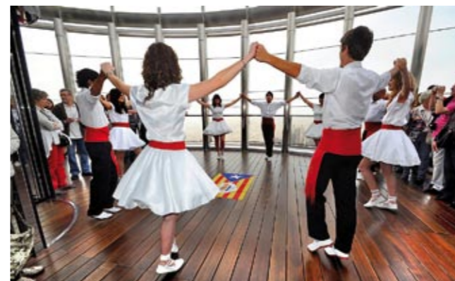
La colla al mirador del Burj Khalifa

Els Dansaires del Penedès, amb l'apassionament que tenen de portar la sardana a llocs on mai abans l'ha ballat ningú, es van plantejar el repte de