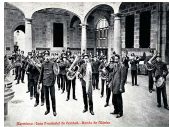
■ Banda de la Casa de Caritat de Barcelona que enregistrà els cinc primers discs de sardanes.