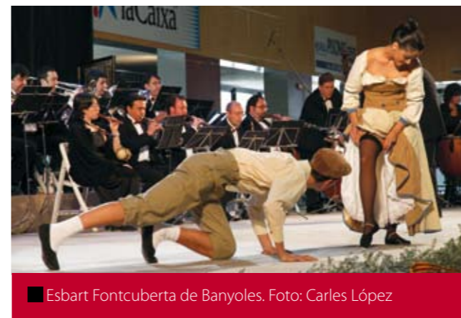
■ Esbart Fontcuberta de Banyoles.

va deixar fa pocs mesos. L'obra porta per títol Reminiscències . Amb aquesta obra l'auditori se sentí prop del mestre. L'Esbart Fontcuberta de Banyoles col·laborà oferint una coreografia de l'obra.