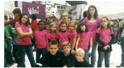
Flor de Fajol

de trofeus als components de les colles sardanistes de l'entitat.