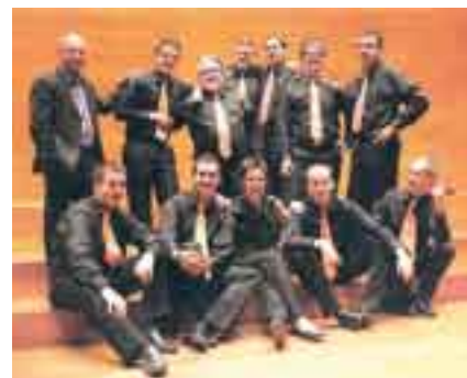
Foto cobla Marinada

El concert de presentació forma part de la cloenda del 2n Cicle d'Historiografia Sardanista de l'Escala, iniciat el passat mes de març.