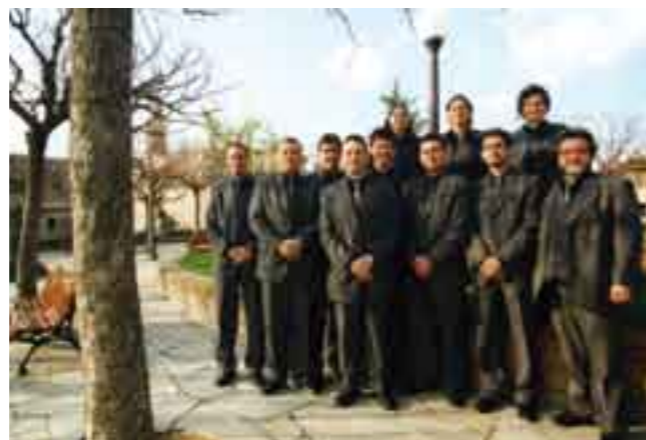
La cobla Marinada a la plaça Major de Castellar del Vallès el dia del seu aplec al març de 2002.