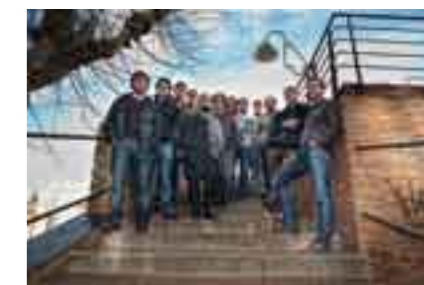
La Cobla Bisbal Jove

ha estat possible gràcies al suport de la Diputació de Girona.