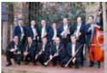
La cobla Mil·lenària de Perpinyà