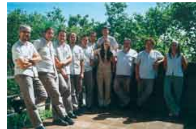
La cobla Marinada amb la formació de l'any 2006.

Els actes de commemoració del 25è aniversari de la cobla Marinada comencen el divendres dia 12 de maig al Teatre Zorrilla de Badalona on ens oferiren un concert com a acte central, amb sardanes d'estrena dedicades a la cobla dels tres compositors que en aquell moment en formaven part. Les sar-