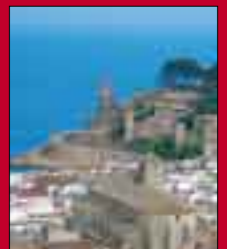
Tosa de Mar.