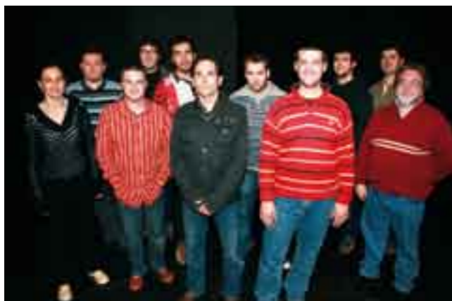
■ Cobla Marinada any 2009.