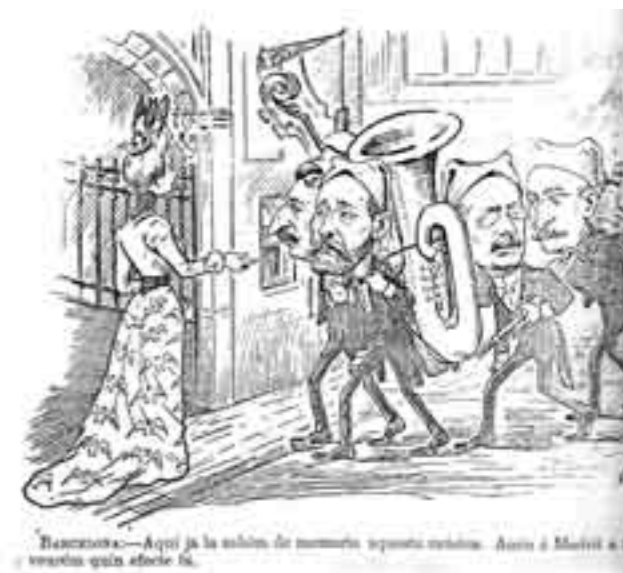
Publicada a la revista satírica Cu-cut! Barcelona 1901. Una banda de música amb les cares dels polítics del moment diu: Aquí ja la saben de memòria aquesta música, aneu a Madrid a tocar-la i veure quin efecte fa.

Tarde: a las 3,00 horas...en las sociedades: El Primitivo, El Fomento, Juventud Católica y Ateneo Bañolense, actuaran las orquestas;