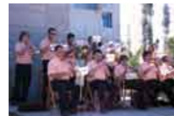
La Principal de Cassà

"Un tomb per la sardana", que ha estat produït íntegrament per la mateixa cobla, surt a la venda a un preu de només 5€. La cobla ha decidit posar un preu tan assequible per tal de fer arribar la sardana a tothom.