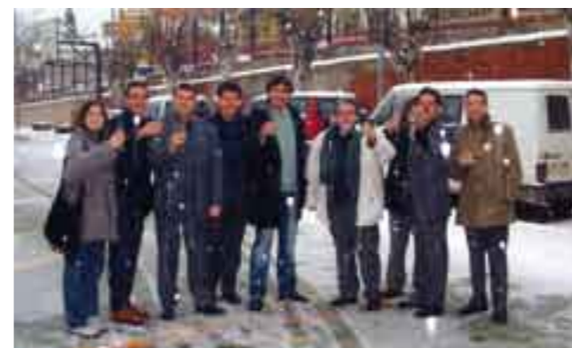
Part de la cobla en un paisatge nevat a Sant Sadurní d'Anoia després d'una calçotada i molt de cava.