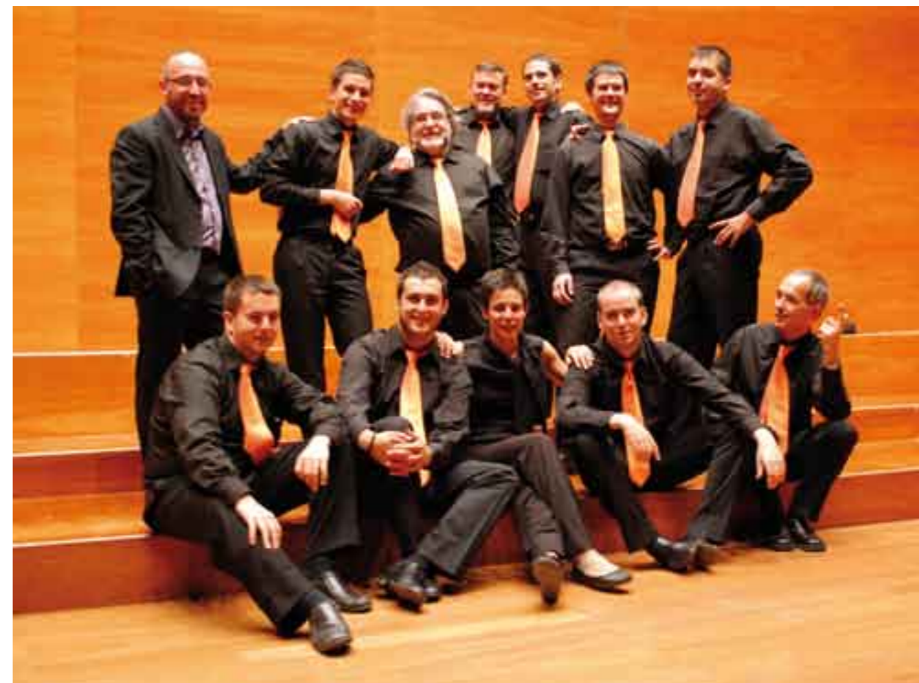
■ La cobla Marinada del 30è aniversari.